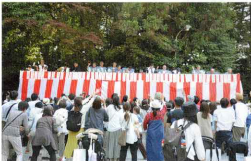
【境内西側と東側の2ヶ所よりお餅撒き】

尚、この記念事業に御奉賛された六五二名皆様の御芳名は、境内西側に掲示され、御神前で御名前を読み上げ祈願祭が執行され、御芳名帳が天神神社に保管された。