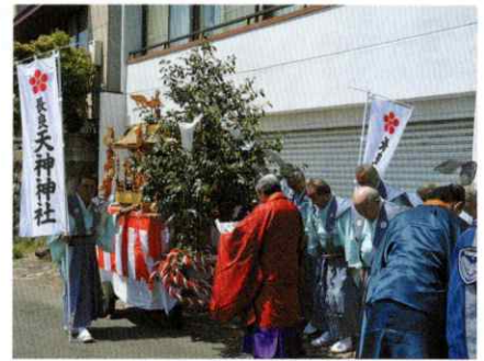
【長良橋下 出発の祝詞】

朝から好天に恵まれ、汗ばむ陽気となり、午後一時より奉祝御稚児行列が行なわれ、伝統的な稚児衣装を身に纏った四三〇名の稚児達と、その家族等千二百名以上が参加した。 長良橋下の右岸河畔に集合し、午後一時神社神輿前で出発の神事が行われ、午後一時三十分号砲を合図に行列が出発した。 先導神職を先頭に、伶人、袴姿の氏子総代が神輿を曳き列を正し、その後を神社巫女に続いて稚児が続き、先導神職が御祓いしながら旧高富街道を北進、約一時間かけて神社まで練り歩いた。拝殿前に到着した稚児は、御祓いを受け、健康やかな成長を祈願して参拝した。参加した稚児は、事前に行灯の