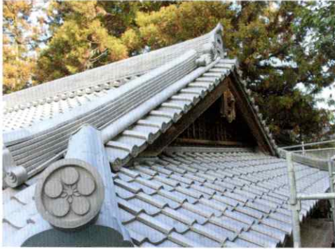
【旧社務所葺き替え竣工】

二年前より準備を進めてきた令和御大典記念大祭が、氏子総代及び特別崇敬者百余名参列のもとで、五月四日午前十時から厳粛に斎行された。