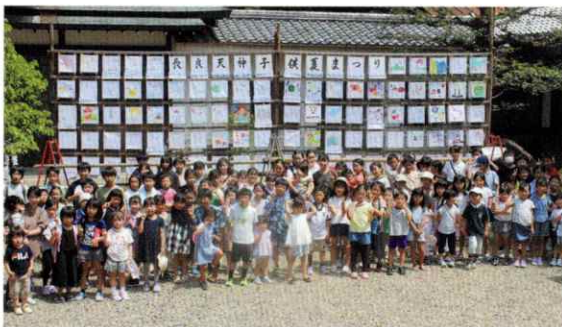
【行灯棚前集合写真】

その後ビンゴゲーム大会で盛り上がり、恒例のカレーライス昼食会を楽しみ、最後にスイカ割りでも賑わい、午後一時頃解散した。この子供祭に参加した子供たちには、記念に集合写真が配られ、奉納された行灯は、ながら幼稚園、桜保育園、諏訪幼稚園、中部短期大学附属幼稚園、いづみ第二幼稚園の園児から事前に奉納された行灯と共に五日から十日の夜点灯された。