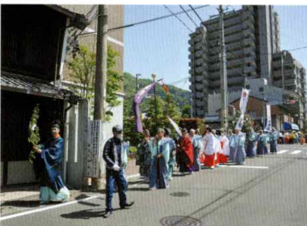
【旧高富街道北進 長良中町】

奉賛金 一、〇三六、〇〇〇円 預金利息 二二円 繰入金 八、六六二、五三八円 計 二〇、六九八、五五九円