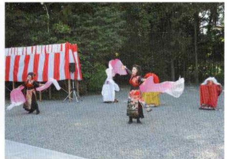
【境内西側 みろく演舞奉納】

尚、この記念事業に御奉賛された六五二名皆様の御芳名は、境内西側に掲示され、御神前で御名前を読み上げ祈願祭が執行され、御芳名帳が天神神社に保管された。